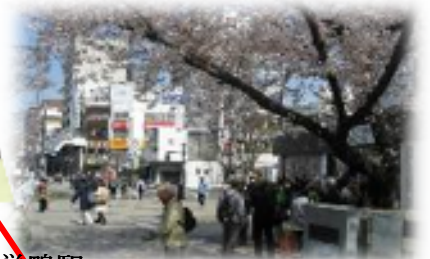
JR 巢鴨駅、都営地下鉄三田線 巢鴨駅