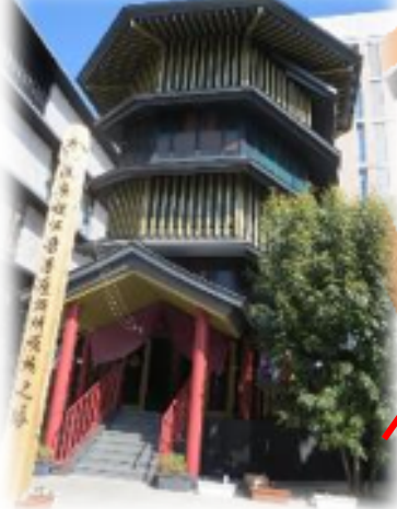
1号館 巢鴨鴨台観音堂