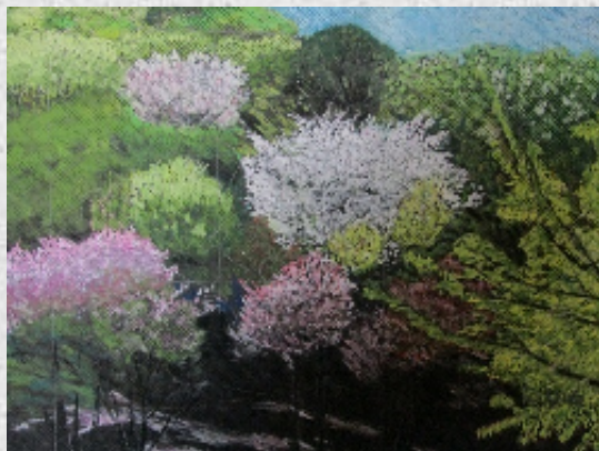
栃木県みかも山春景色 伊部雄介