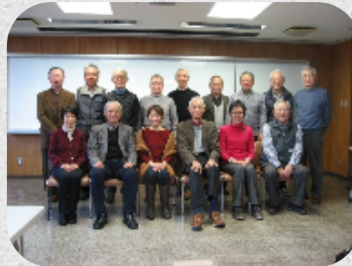
女性モデルのスケッチ