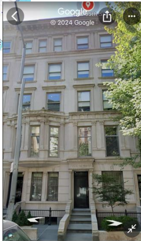
14 E 95th St 14 E 95th St, New York, NY 10128... 建築物