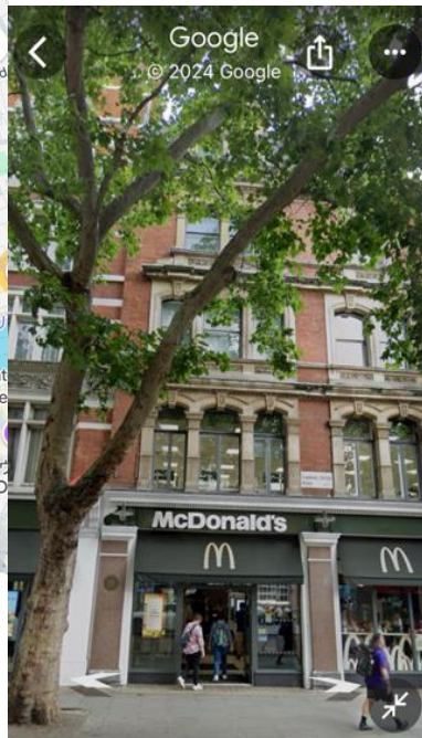
84 Charing Cross Rd 84 Charing Cross Rd, London WC...