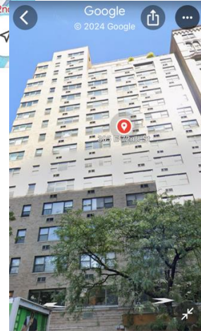
305 E 72nd St 305 E 72nd St, New York, NY 100...